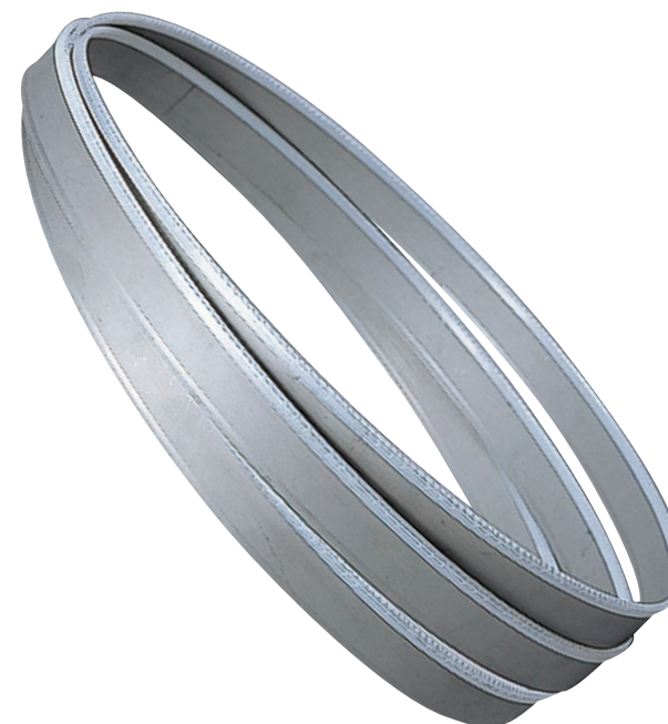
「カットオフ」ピッチ選定表

特徴：①刃はコバルトハイス。 ②汎用性があり、一般構造用鋼から合金鋼まで幅広く使用。