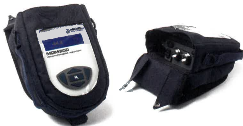
MDM300 キャリング・ケース(ソフト)