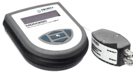
MDM300+サンプル・ガス 吸引用ポンプ