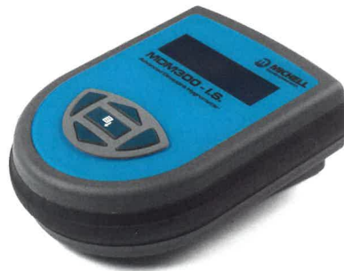
MDM300 IS 側面