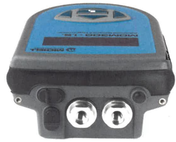
MDM300 IS 裏面図