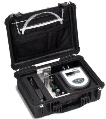
MDM300 サンプリング・システム 一体型ケース組込仕様