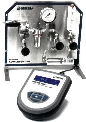
MDM300 高圧サンプリング・システム